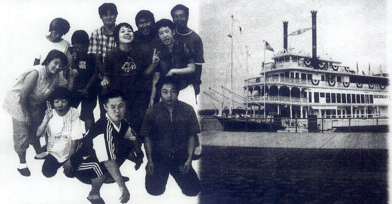
げんちじっこういんいちどう 現地実行委員一同