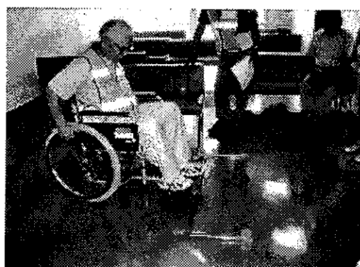
接し方体験（知的障がい者不自由さ体験）

●小平市身体障害者協会、小平肢体不自由児者父母の会では、車いす体験を実施しました。車いすを操作して、わずかな段差を越える難しさなどを体験しました。参加者からは、「時間が短かった」「もっと早く知っていたら」といった反響が寄せられました。今後もこうした体験を開催する予定です。